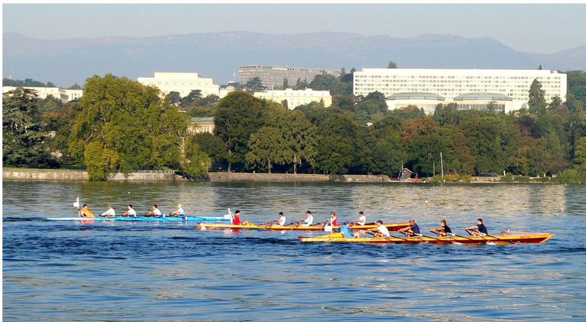
Les participants longeant l'ONU